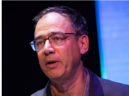
ניצן גיבוי לחוקרים

יואב יצחק • מו"ל ועורך ראשי • News1 דוא"ל • בלוג/אתר • רשימות • מעקב