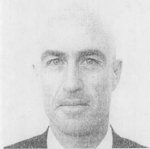
כתבתו של רוני בלכר בגלובס, 20/8/2016

בתמונה: שמאי בקר. צא לעבוד כעו"ד פרטי. קבל עצה מעשית מיודעי דבר.