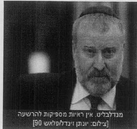
מנדלבלית. אין ראיות מספיקות להרשעה