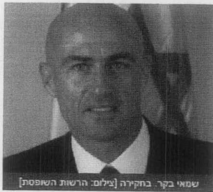
שמאי בקר בחקירה

השופט יצא במפתיע לחופשה מאולצת בעקבות מידע על מעשים חמורים שביצע. המידע הועבר לטיפול היועץ המשפטי לממשלה - בניגוד לנדרש - מערכת המשפט נמנעה מדיווח לציבור