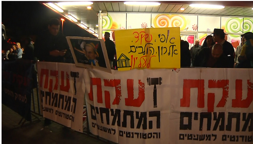
מחאת המתמחים

1,500 מתמחים בעריכת דין שיגרו הערב (יום ה') מכתב לשרת המשפטים איילת שקד שבו הם דורשים לחקור את "הליקויים והפגמים שנפלו בבחינת לשכת עורכי הדין ב-10 בדצמבר". במכתב לשרה שקד וליו"ר הוועדה הבוחנת של הלשכה, שופט בית המשפט העליון יוסף אלרון, הם התלוננו על הטיה מכוונת של תוצאות הבחינה. ארבעה מתמחים הגישו תלונה במפלג חקירות הונאה במשטרת תל אביב נגד לשכת עורכי הדין . הם גרסו כי הייתה הטיה מכוונת של תוצאות הבחינה וזיף בכוונה.