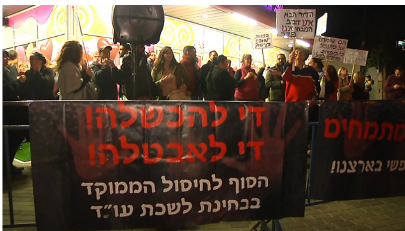
טענות ל"חיסול ממוקד" בבחינות הלשכה

• לעיון במכתבם של המתמחים לשרה שקד - לחצו כאן