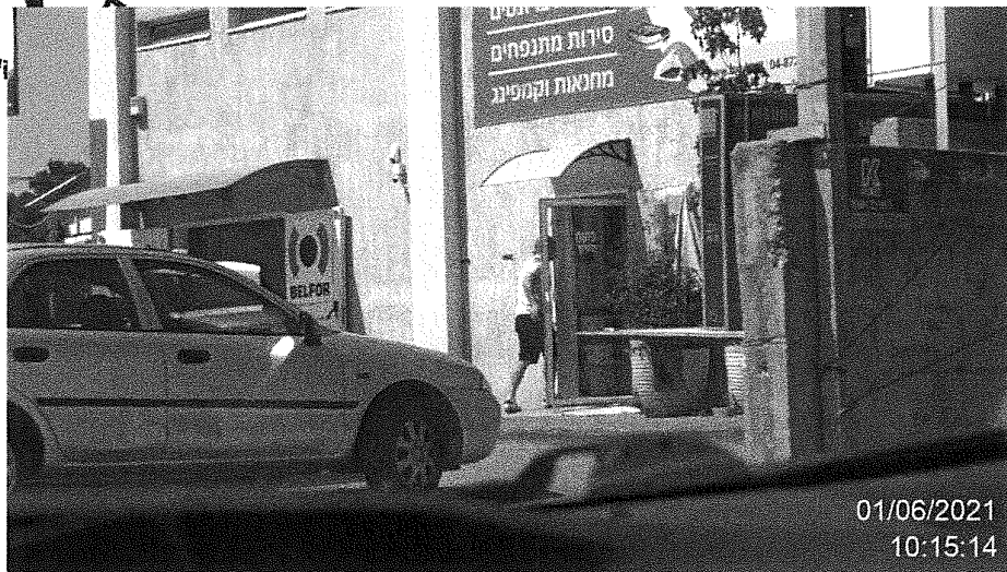
הנדון תועד מגיע לבית העסק "הכול לים" בדרך חיפה 19 קריית אתא.