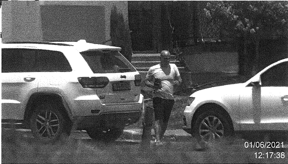
הנדון בסמוך לרכבו אוחז בידי כול הנראה שטרות כסף במזומן אותם קיבל מחברת "חוסן"