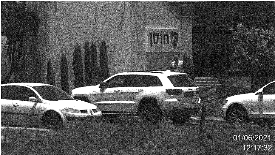
הנדון ביציאה מחברת ניכיון השקים "חוסן"