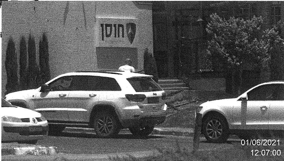
הנדון מגיע לחברת "חוסן" בכניסה לקיבוץ מזרע לביצוע ניכיון שקים אותם לקח מ"פוטוגרפיקס"