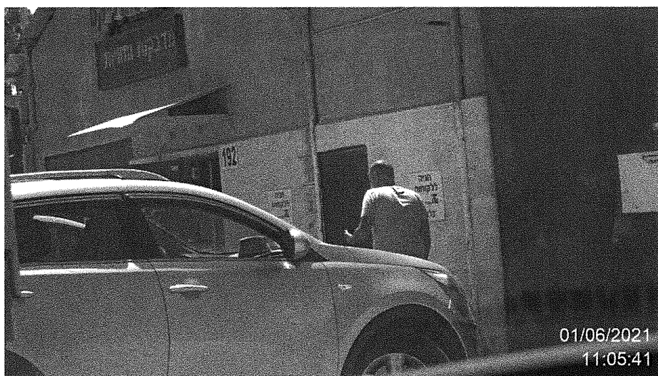
הנדון מתועד נכנס לבית העסק "פוטוגריפיקס" ברחוב שדרות ההסתדרות 192 חיפה.