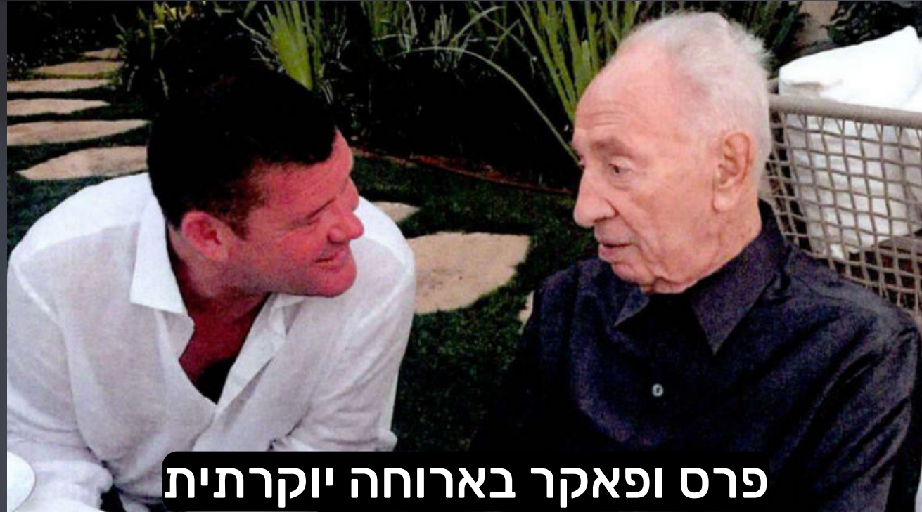
פרס ופאקר בארוחה יוקרתית

יודגש שהיחסים בין ארנון מילצ'ין לשמעון פרס ז"ל היו מאוד קרובים במשך שנים ארוכות ואחריו גם ג'יימס פאקר הצטרף לקרבה הזו . במקביל לדעיכת שמעון פרס בסוף דרכו, הצמד הזה החלו לטפח את הקשרים ההדוקים גם עם יאיר לפיד - מי שהם ראו בו כממשיך דרכו של שמעון פרס. הקרבה הזו לא הייתה בחינם ולשם שמיים: הם קבלו בתמורה פטור מתשלום מיסים בכל העולם, הטבה לא חוקית בשווי מצטבר של מאות מיליוני דולרים, לכל אחד מהם. מדהים לקרוא בספר עד כמה מילצ'ין העתיר על פרס הטבות למיניהן: אירוח בדירות היוקרה שלו, טיסות במטוסו הפרטי, ארוחות, תמיכה כספית לקידום דרכו הפוליטית וכד' ושום ביקורת ציבורית בעניין. ונתניהו קיבל הרבה פחות ונאשם בשוחד במקום לפיד. (סיכום הספר כאן )