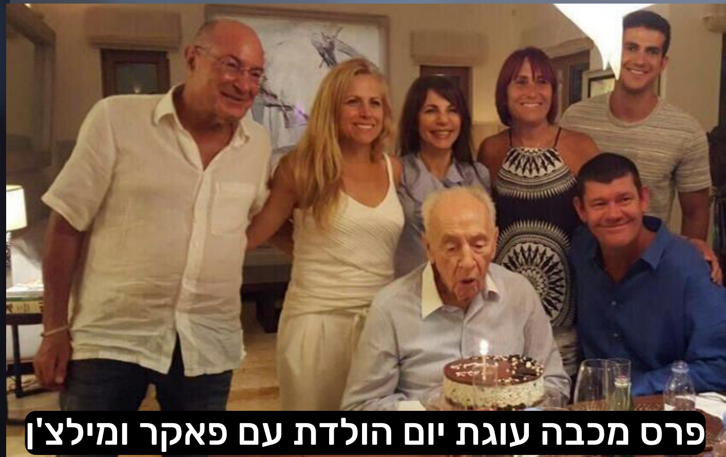
פרס מכבה עוגת יום הולדת עם פאקר ומילצ'ין

יודגש שהיחסים בין ארנון מילצ'ין לשמעון פרס ז"ל היו מאוד קרובים במשך שנים ארוכות ואחריו גם ג'יימס פאקר הצטרף לקרבה הזו . במקביל לדעיכת שמעון פרס בסוף דרכו, הצמד הזה החלו לטפח את הקשרים ההדוקים גם עם יאיר לפיד - מי שהם ראו בו כממשיך דרכו של שמעון פרס. הקרבה הזו לא הייתה בחינם ולשם שמיים: הם קבלו בתמורה פטור מתשלום מיסים בכל העולם, הטבה לא חוקית בשווי מצטבר של מאות מיליוני דולרים, לכל אחד מהם. מדהים לקרוא בספר עד כמה מילצ'ין העתיר על פרס הטבות למיניהן: אירוח בדירות היוקרה שלו, טיסות במטוסו הפרטי, ארוחות, תמיכה כספית לקידום דרכו הפוליטית וכד' ושום ביקורת ציבורית בעניין. ונתניהו קיבל הרבה פחות ונאשם בשוחד במקום לפיד. (סיכום הספר כאן )