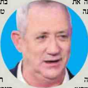
שר הביטחון בני גנץ. הפיקוח על יצוא סייבר התקפי

ברשימה שהתפרסמה בנובמבר לא נכללות מדינות דוגמת מרוקו, מקסיקו, ערב הסעודית או איחוד האמירויות אשר על פי הפרסומים רכשו מערכות סייבר התקפי של חברת NSO. החברה הישראלית אמנם לא אישרה את מרבית הפרסומים אבל ציינה שלכל המדינות אליהן מכרה היא קיבלה את אישור המדינה. אם טענתה של החברה הישראלית אכן נכונה, אז משתמע שישראל השתמשה בצורה מדינית מאוד באישורים המיוחדים שהיא רשאת לתת והיתה מיודעת בכל מקרה לאן מוכרת החברה הישראלית.